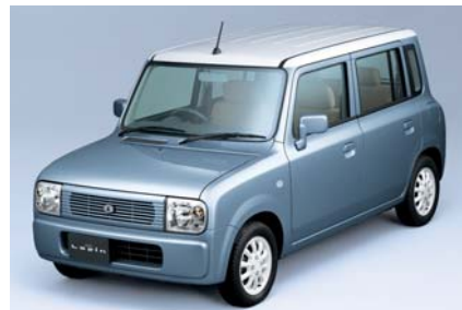
2002年 ラバン ラバンを作ることで、自分の意識も大きく変わった。「モノに対してどれだけ精神性が盛り込めるか」というところがね、まだまだかなと思っっています。もうちょっと愛着の持てる、可愛がりたくなる魅力、そういうものが出てくるといいと思います。」