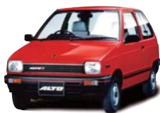
1984年 アルト(2代目) Japan Best Car Design Award 大賞

2~5代目まで、歴代のアルトを担当。「一番安くて、確実に売らなげやいけなククルマ。数を売るのが難しい、プレッシャーはすごいですよ。」