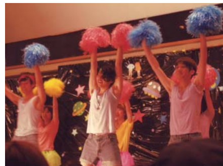
西キャンパスの様子