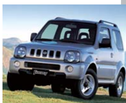
1998年 ジムニーワイド グッドデザイン賞受賞 Off Road and 4Wheel Drive Magazine Best 4x4 OF THE YEAR