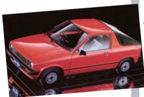
1983年 マイティボーイ