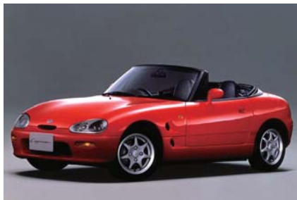
1991年 カプチーノ グッドデザイン賞受賞 Auto Design92 デザイン大賞 Auto Design92 スポーツカー部門賞