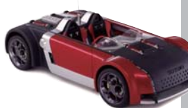
2001年 GSXR-4 東京モーターショー ショーモデル