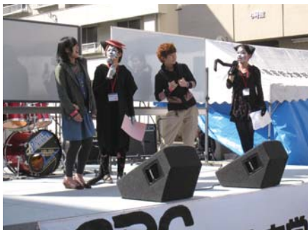
東キャンパスの様子

西 キャンパス 今年のテーマは「アラタ」 「アラタ」とは漢字で「新(しん)(あたらしい)」と書きます。また、それぞれの頭文字を取ると、「A・R・T」で「アート」になり