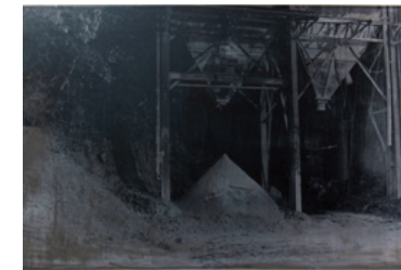
Shoki Tanaka / 2015年「Sedimented Landscape」