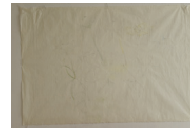
Kimiko Torisu / 2014年「Pflanze」