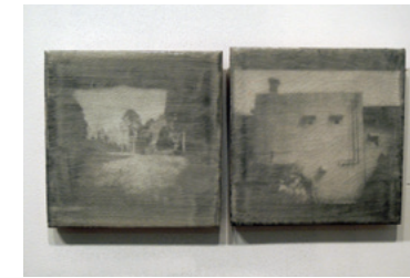
Naoto Nakada / 2016年「Shigaraki time」