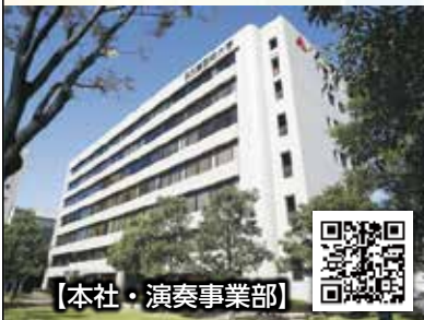
【本社・演奏事業部】