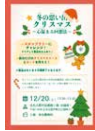
12月のイベントのチラシ。このチラシで「7月の続きですか!」と分かって頂けた