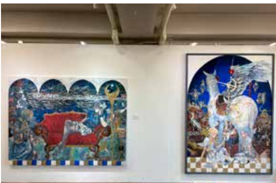
藤田 大翔 / 群レテモサカナイ