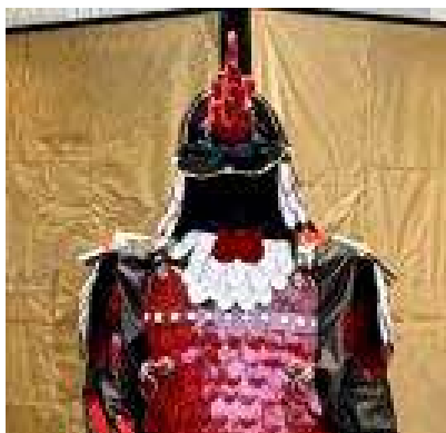
今井 若菜 / 紅白漆塗若鶏胴具足