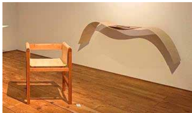
白井 空 / 出汁巻き