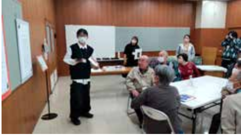
イベント協力者「いきいき隊」の方々に説明する学生