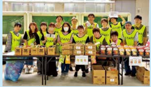
学生支援活動：西キャンパス