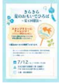
7月のイベントのチラシ。1年次の学びを活かし芸術教養生が作成