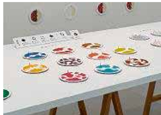
水野 亜友加 / 視覚で食べる