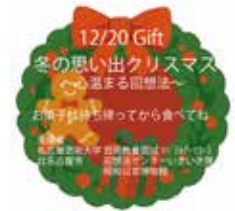
景品に貼ったシール。チラシを作った領域生が個々のアイテムを描き、配置は別の学生が行った。イベントを帰宅後思い出して頂く工夫