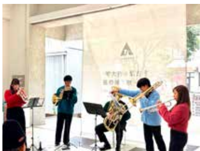
ウィークエンドコンサートの様子

今年度も卒展関連企画として、記念講演会をはじめ、さまざまな催しを実施いたしました。卒業記念講演会には、日本を代表するファッションデザイナーの一人である 皆川明 氏にご登壇いただき、