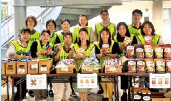
学生支援活動：東キャンパス