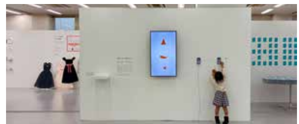
優秀賞 「[見る] から [感じる] へ」加藤もも (デザイン・ヴィジュアルデザイン)