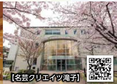
【名芸クリエイツ滝子】