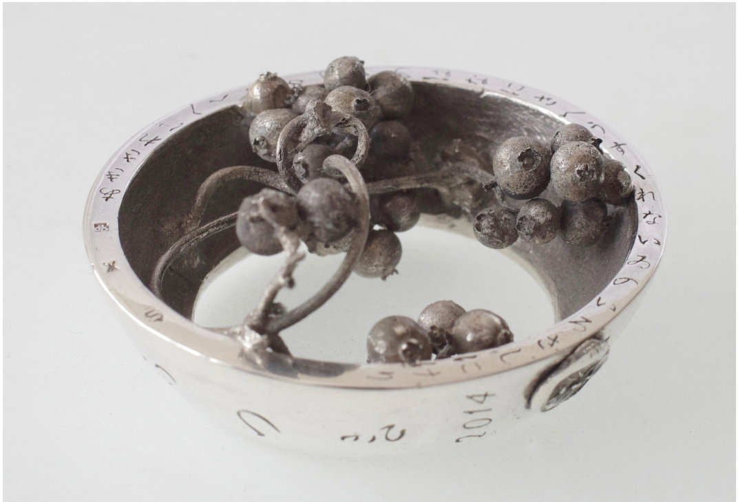
あささればへくそかづらのはなにさへうすくれなゐのいろさしにけり しもつき 2014 Paederia scandens 55×59×27hmm Silver950