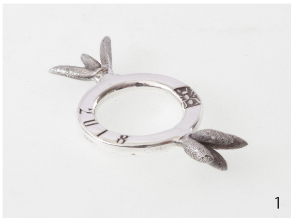
マツバギク Lampranthus spectabilis 2018 47×25×8mm Silver950