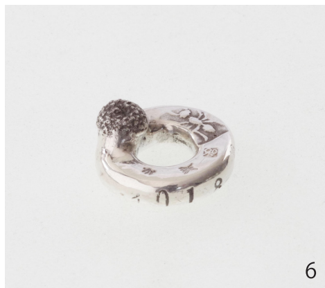
タンポポ Taraxacum officinale 2018 14×14×6.5mm Silver950