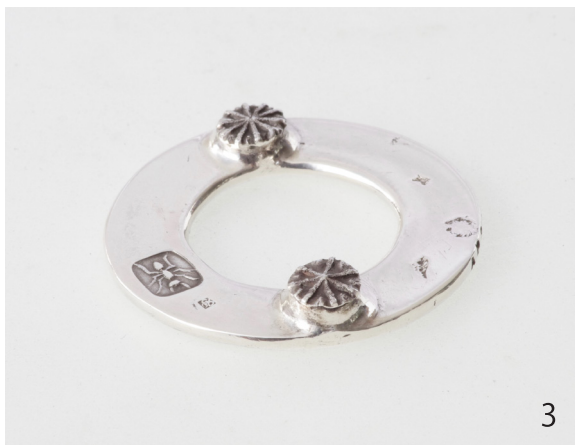
ヒナゲシ Papaver rhoeas APRIL 22 2018 39×38×6mm Silver950