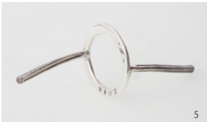
タカサゴユリ Lilium formosanum 2018 31×31×80mm Silver950