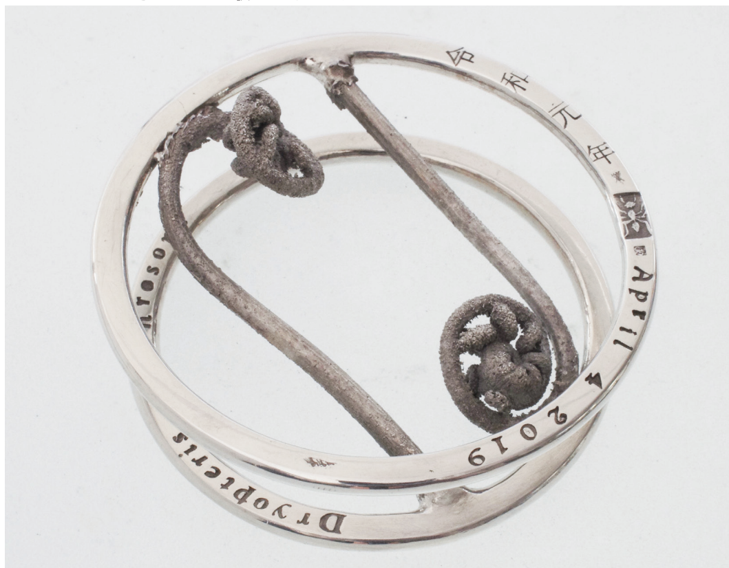
令和元年 April 4 2019 Dryopteris erythrosora 65×66×23hmm Silver950