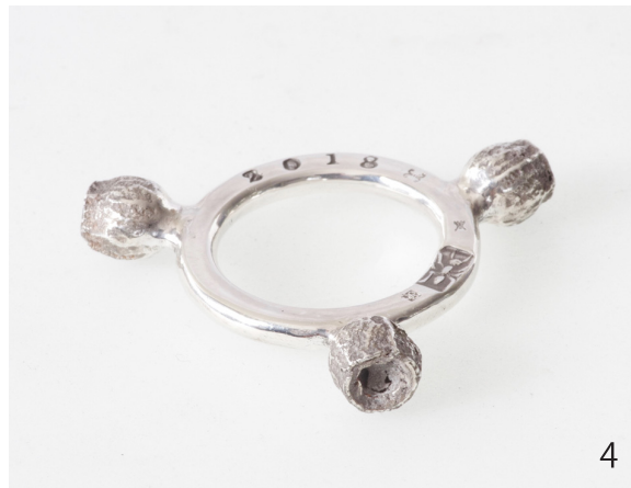
ユーカリ Eucalyptus 2018 47×38×8.5mm Silver950