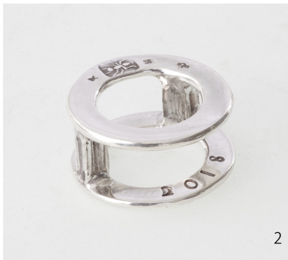
アレチハナガサ Verbena brasiliensis 2018 30×30×15mm Silver950