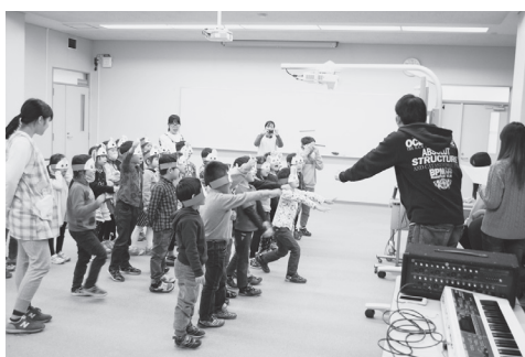
図5. お面を被り声援を送っている様子

タブレット端末でのお絵描き、お面作り、劇の鑑賞を園児に体験してもらい、その様子や反応、コンテンツの内容に関して幼稚園のクラス担任に対しアンケートを実施し、その結果を得ることによりコンテンツの必要性・有効性を確認した(表1~4)。さらに劇を実施した学生からも感想を得た(表5)。