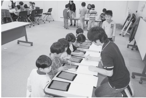
図1. タブレット端末で絵を描く様子