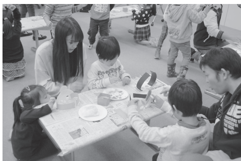
図3. お面を製作している様子

劇では、電子黒板に登場するバーチャルのキャラクターとリアルな人物の間で掛け合いをしながら進行する(図4)。劇の最大の山場では、園児の描いた野菜が次々と登場するので、園児にお面を付けて声援することで悪者を倒すパワーを送るよう促した(図5)。