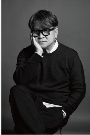
Portrait: Ryū Tamagawa