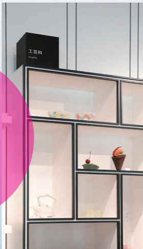
科ごとに仕切られた棚