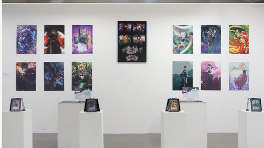
丸岡 慎一 デザイン領域 イラストレーションコース講師