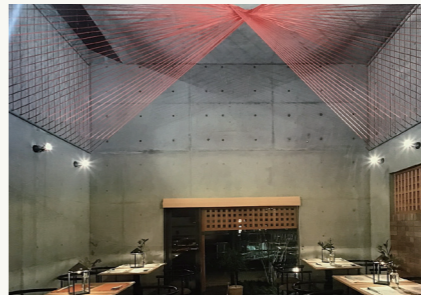
この部屋は現在はギャラリースペースだが、昔はレストランスペースだった。織部亭は様々な展覧会を開催しているギャラリーカフェ。ランチの種類も豊富です。織部亭 愛知県一宮市島崎1丁目11-19 (TEL 0586-76-1993)