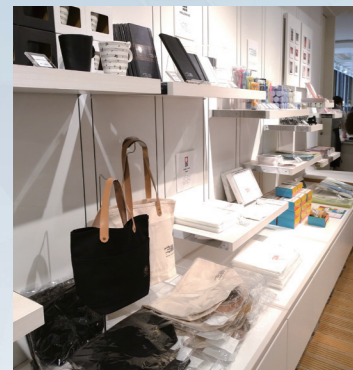
オリジナルグッズはリーズナブルなお値段

販作品の展示スペースは大きく二つに分かれています。ホワイトキューブを含む企画展と、20mに及ぶ壁面の常設展です。企画展は様々模索中ではありますが、藝大の先生方からもアイデアをいただきながら、運営スタッフでテーマを設けた展覧会を企画しています。また、学生を対象としたコンペティションや研究室による企画展も開催しています。常設展示では各科からのご推薦の作品であったり、卒業後も活躍しているOBを探したりと、各科と連携を取りながら、作家を増やしているところです。