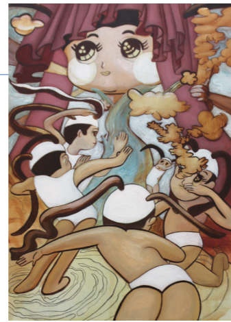
「カイマミ」油彩・キャンパス 2017年

会期：2019年10月6日[日]–12月26日[木] 展示場所：愛知県名古屋市中区栄1丁目2番49号 テラスセナビル2F屋外ショーウィンドウ ※ショーウィンドウのため24時間ご覧いただけます 主催：学校法人名古屋自由学院 施設運営管理：名古屋芸術大学地域交流センター 展覧会運営管理：名古屋芸術大学アート&デザインセンター 連絡先：gallery-box@nua.ac.jp 一部の展示作品はご購入いただけます