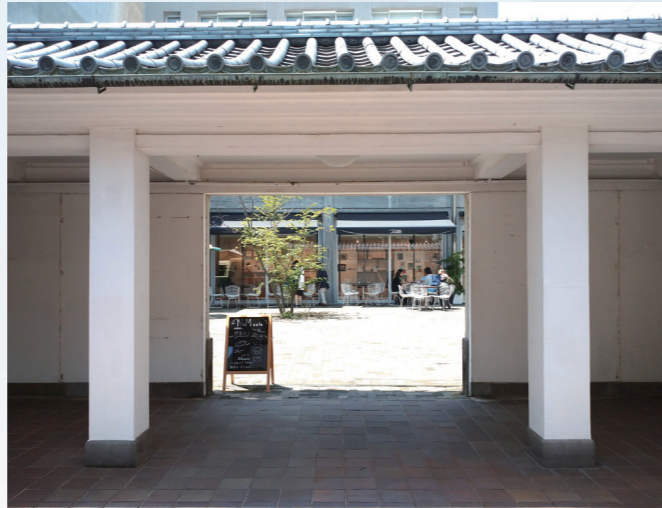
上野恩賜公園から東京藝術大学旧正門を通り過ぎ、正木門より正面に見える建物が藝大アートプラザ