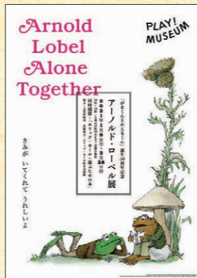
アーノルド・ローベル展 チラシ