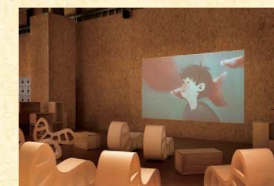
PLAY! PARK <シアター>