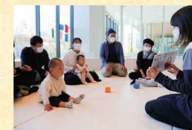
PLAY! PARK ワークショップ「絵本でPLAY!」