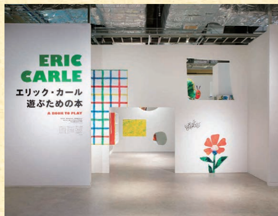
「エリック・カール 遊ぶための本」展 展示風景