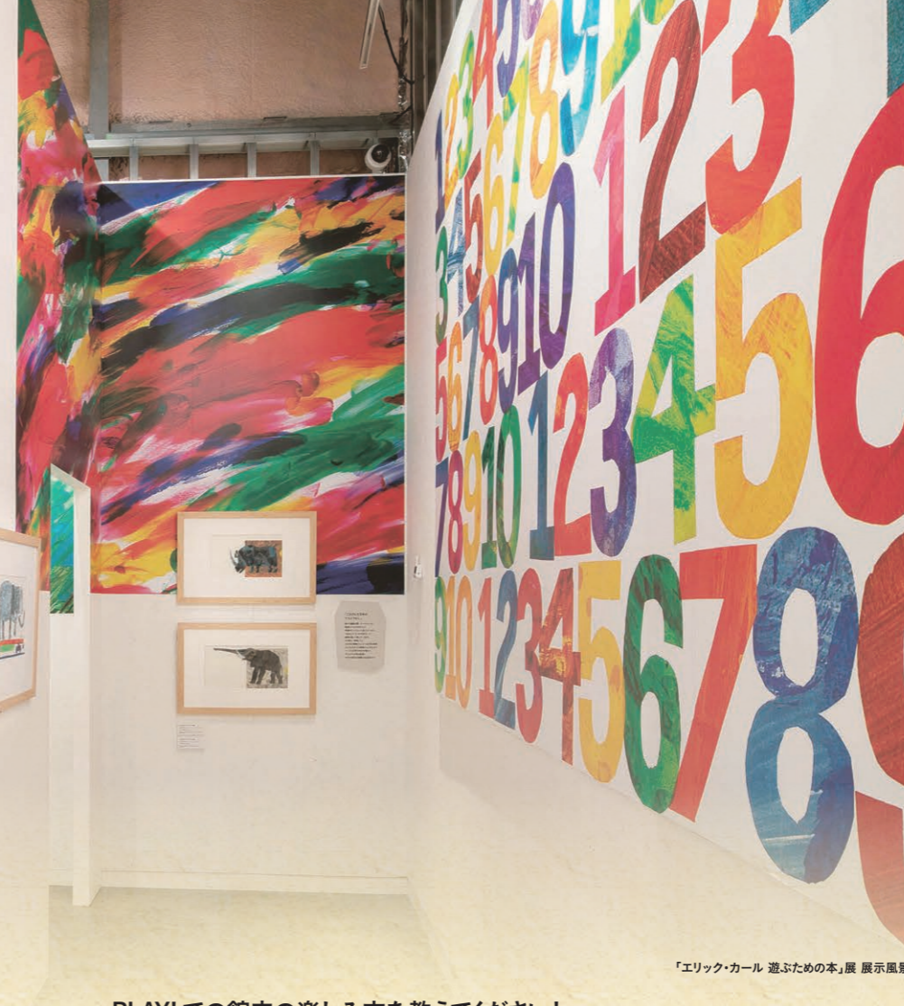
「エリック・カール 遊ぶための本」展 展示風景