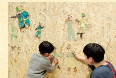
PLAY! PARK <ギャラリー>