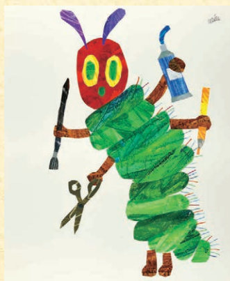
『はらべこあむし』イラストレーション 制作年不明

いつ頃から開設の構想があったのですか？ 開設のきっかけなどありましたら教えてください。