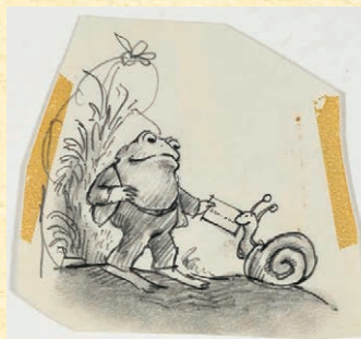
『ふたりはともだち』(1970) 『おてがみ』スケッチ Courtesy of the Estate of Arnold Lobel. © 1970 Arnold Lobel. Used by permission of HarperCollins Publishers.

O ：パークはどう遊ぶか自分次第という場所です。土日はおめかしして遠くから来られる方が多く、こだわったワークショップ、写真や音楽、アート好きな印象を受けるお客さまが多いです。非日常を楽しみに来られている感じがします。対して平日は近場の方がふらりと遊びに来たりして、日常の中に溶け込んでいるのかなと思います。