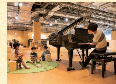
PLAY! PARK <スタジオ>