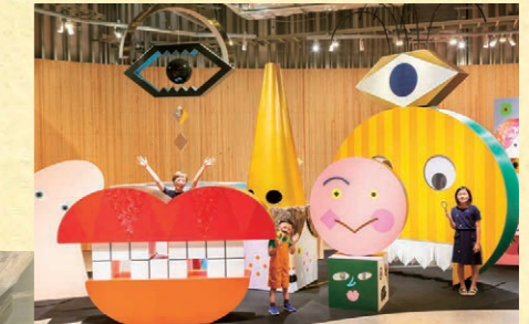
PLAY! MUSEUM「tupera tuperaのかおてん。」 *現在は終了