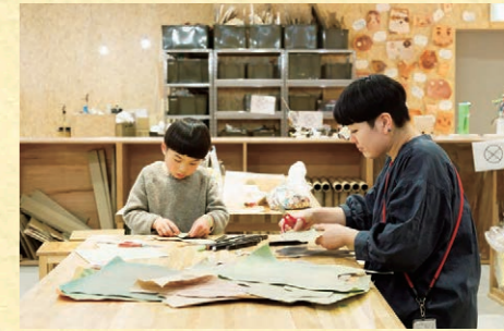
PLAY! PARK ワークショップ「わたしたちももだち」