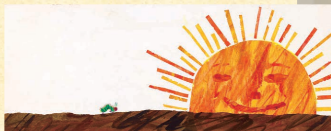
『はらべこあむし』原画 1987年 Collection of Eric and Barbara Carle, Courtesy of The Eric Carle Museum of Picture Book Art, Amherst, Massachusetts. © 1969, 1987 Eric Carle.