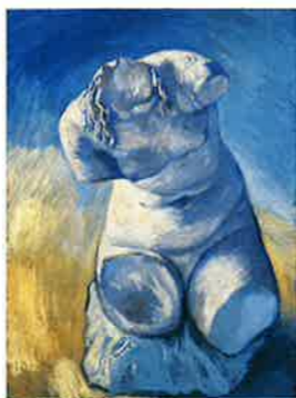
フィンセント・ファン・ゴッホ 《石窯トルソ(女)》1887~88