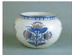
板谷波山《彩磁華花文水差》1917~25頃