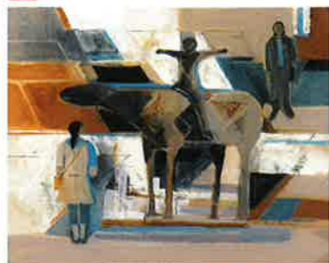
島田章三《彫刻がある空間》2012