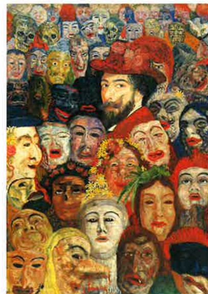
ジェームズ・アンソール 《仮面の中の自画像》1899