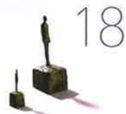
アルベルト・ジャコメッティ 《小像(男)》《小像(女)》1946頃