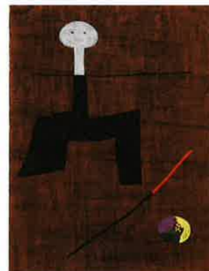
ジョアン・ミロ《絵画》1930 初公開コレクション