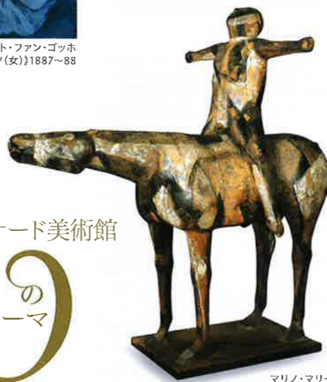
マリノ・マリニ 《馬と騎手(街の守護神)》1949

1987年に開館したメナード美術館は、2017年10月に開館30周年を迎えます。