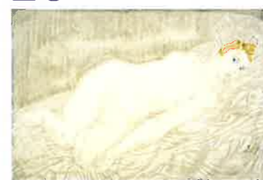
レオナルド・フジタ(藤田嗣治)《裸婦》1927