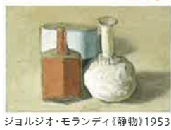
ジョルジオ・モランディ《静物》1953