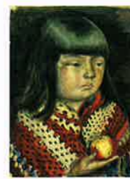
岸田劉生《林檎を持てる麗子》 1919