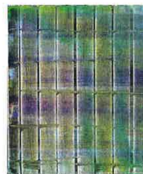
ゲルハルト・リヒター 《アブストラクト・ペインティング》1992 初公開コレクション