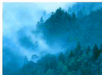
東山魁夷《雲立つ嶺》1976