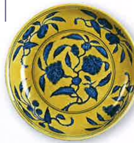
《黄地青花花果文盤「大明正徳年製」銘》明時代