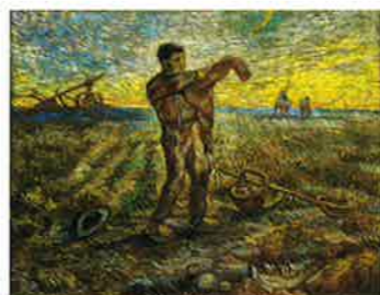
フィンセント・ファン・ゴッホ 《一日の終り(ミレーによる)》 1889~90