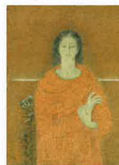
高山辰雄《明けゆく時》1982