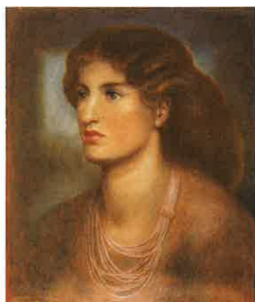
ダンテ・ゲイブリエル・ロッセッティ《肖像》1869 初公開コレクション